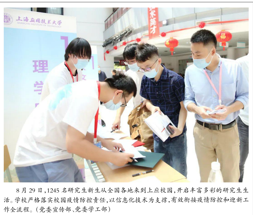
8 月 29 日,1245 名研究生新生从全国各地来到上应校园,开启丰富多彩的研究生生活。学校严格落实校园疫情防控责任,以信息化技术为支撑,有效衔接疫情防控和迎新工作全流程。(党委宣传部、党委学工部)