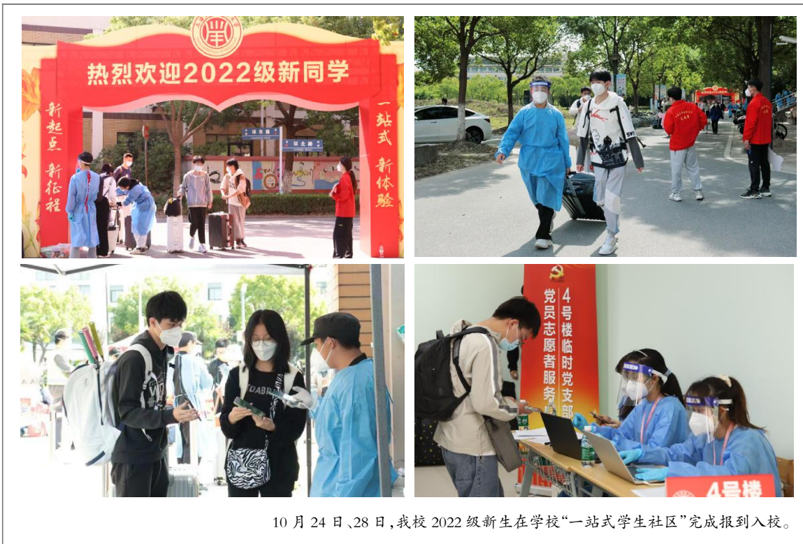
10 月 24 日、28 日,我校 2022 级新生在学校“一站式学生社区”完成报到入学。